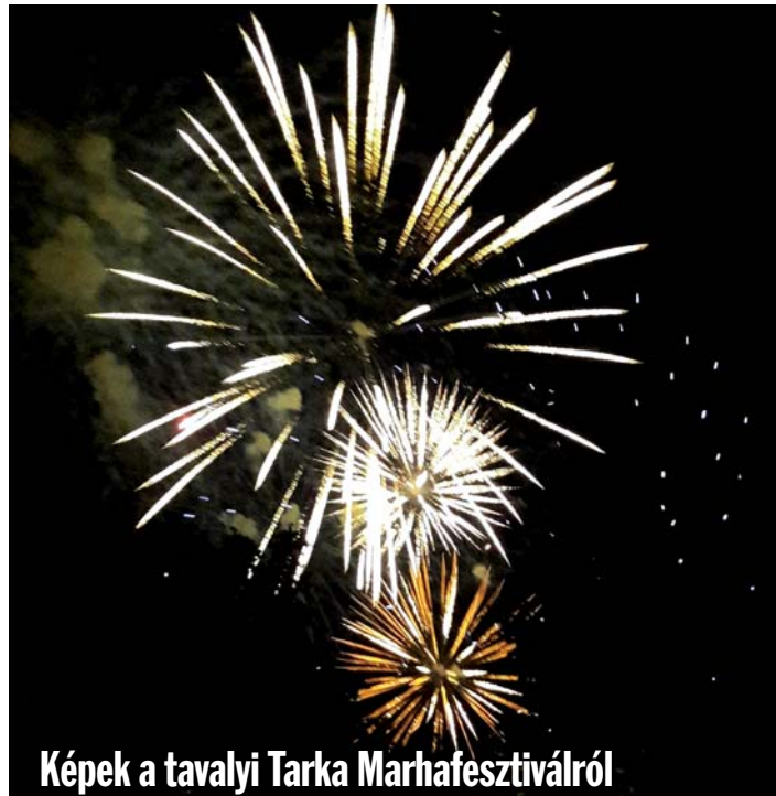
Képek a tavalyi Tarka Marhafesztiválról