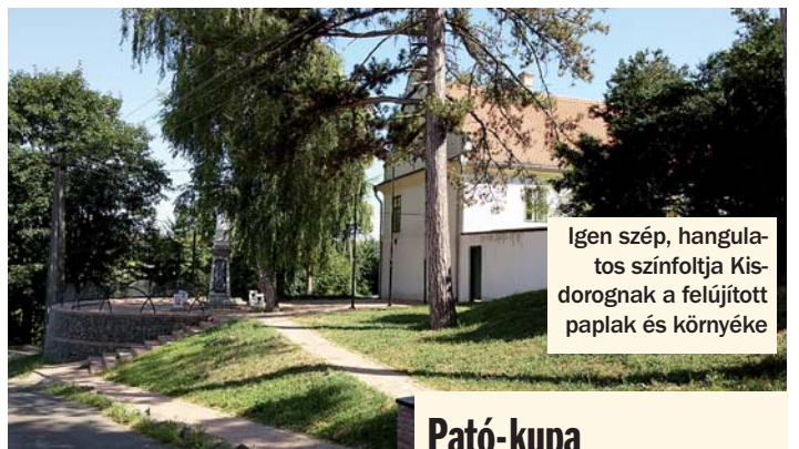
Igen szép, hangulatos színpoltja Kisdorognak a felújított paplak és környéke