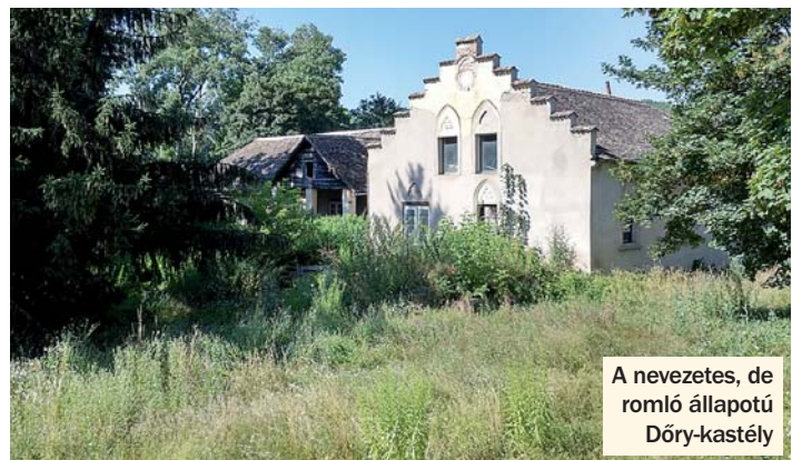
A nevezetes, de romló állapotú Döry-kastély

– Falunapot nem, de valami olyasmit igen. Nálunk hagyomány, hogy az augusztus 10-i Lőrinc naphoz legközelebbi vasárnapon tartjuk a búcsút a sporttelepen, ez most 7-én volt. Nagy búcsú szokott lenni minden évben, vásárral, körhintákkal, ehhez csatlakoznak különböző rendezvények, beszélnek a civil szervezetek, a Kis-