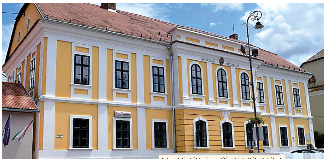
Az első ütem megnyitóján