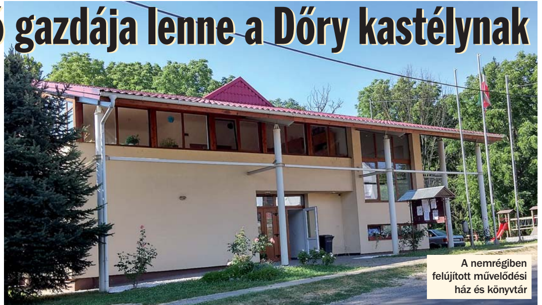
A nemrégiben felújított művelődési ház és könyvtár

A Döryek uralkodtak egykor ezen a vidéken, a 17-19. században, kastélyuk Kisdorogon ma is áll. Bár talán túlzásnak tűnhet kastélynak nevezni a kétszintes, 200 négyzetméteres kúriát. A Döry bárók egykori lakhelye ma siralmas állapotban van. Inkább lehet romhalmazznak nevezni, mint kastélynak. Szomorú ez, mert azért ezek a falak mégiscsak Kisdorog, sőt, a megye, az ország történelmének részei és tanúi. Ma egyik tulajdonostól, befektetőtől sodródik a másikig, adják-veszik, de láthatóan senki nem törődik vele, hogy lassan az enyészeté lesz.